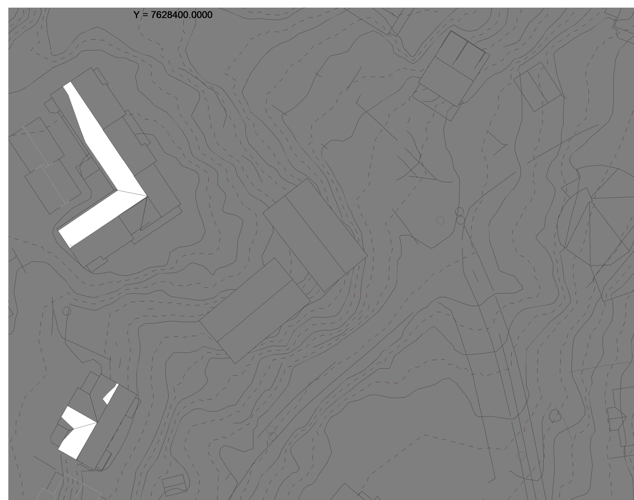
21. mars kl 18.00