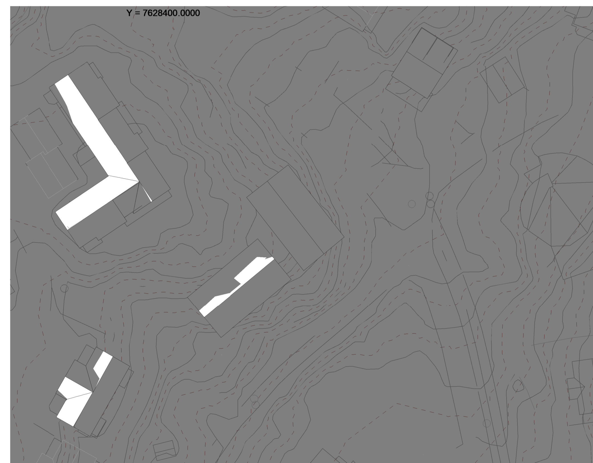
21. september kl 18.00