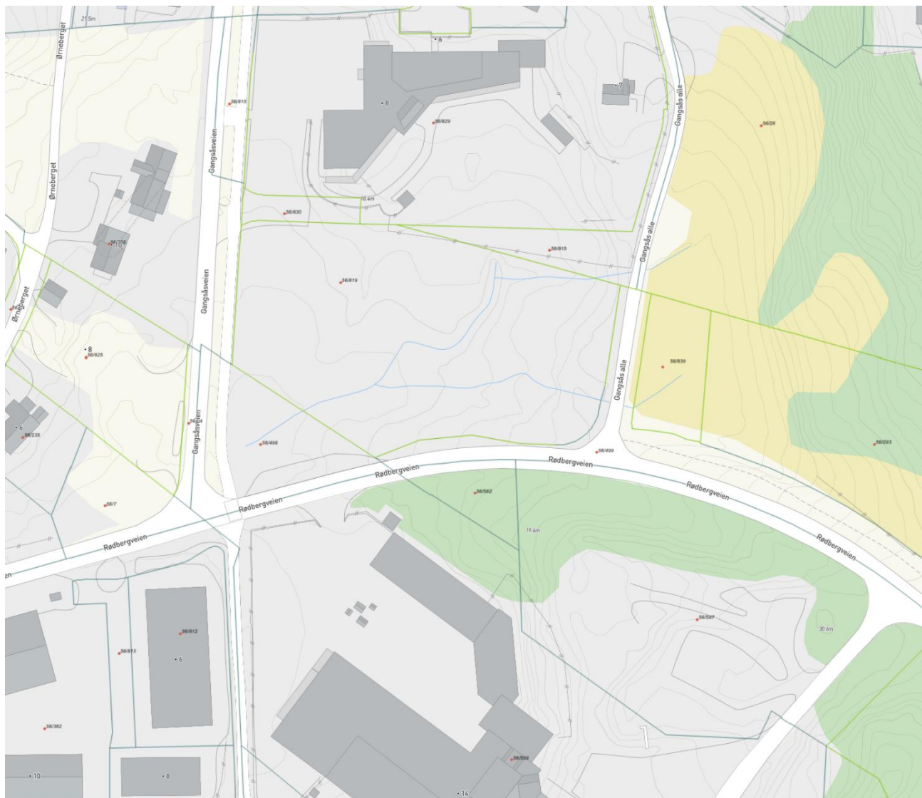
Illustrasjon 3. Eiendommer innenfor planområdet